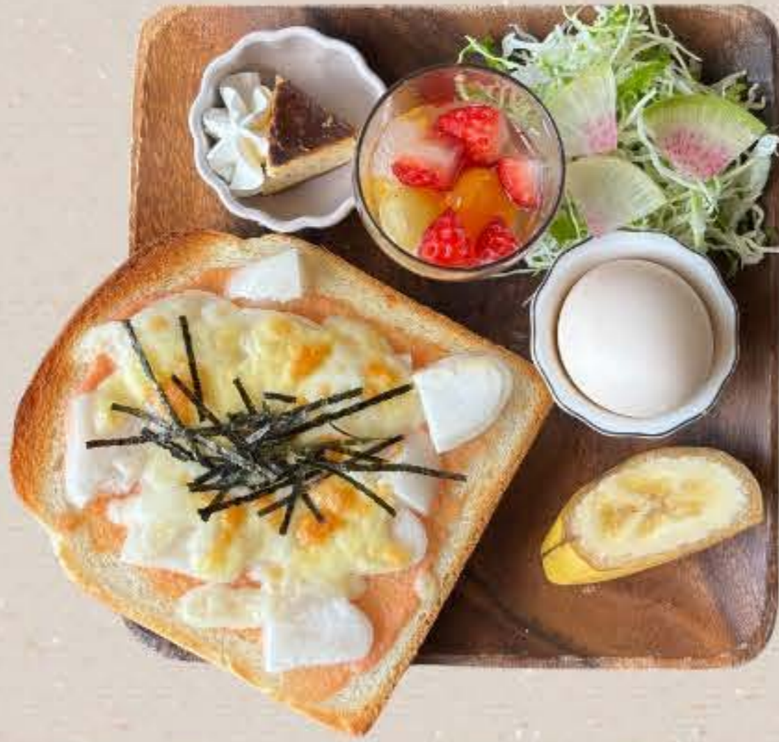
明太子もちチーズトースト 800yen