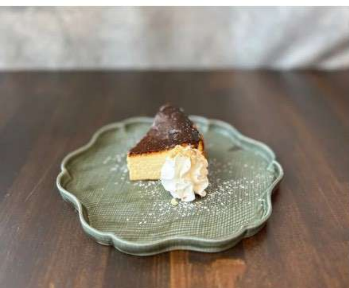
ミニバスクチーズケーキ 400yen