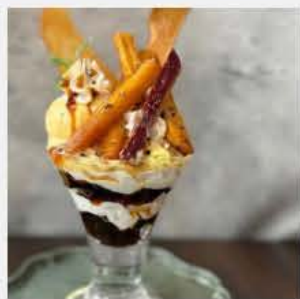
季節のミニパフェ