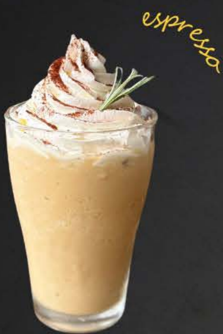
エスプレッソフラッペ 700yen