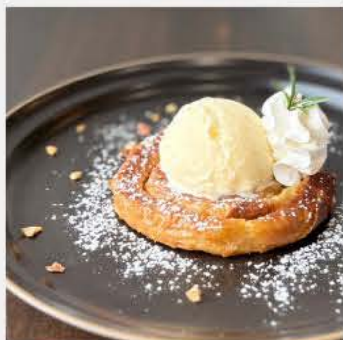
渦巻フレンチトースト