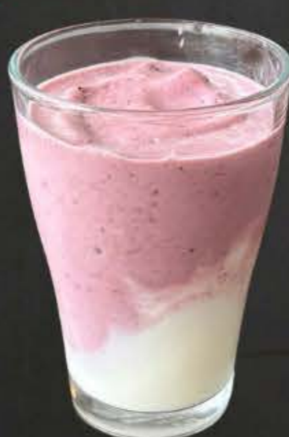
アサイーヨーグルト スムージー 750yen