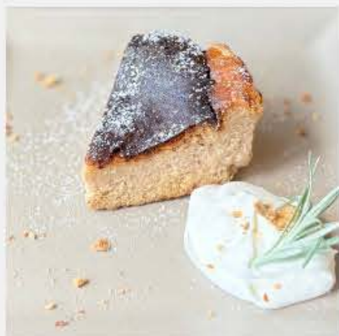
自家製バスクチーズケーキ