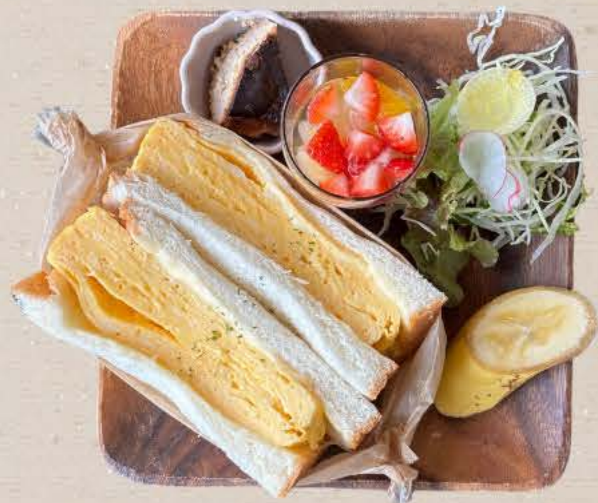
厚焼きたまごサンド 1000yen

当店大人気の「バスクチーズケーキ」 とフルーツポンチのミニデザート付き♪ ランチに大満足なプレートです。