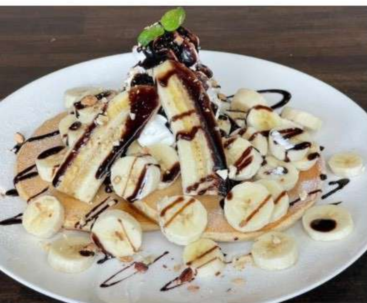
チョコバナナパンケーキ 1,580yen