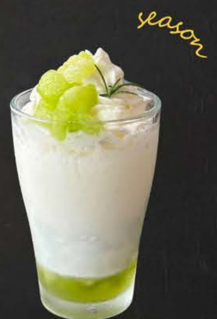
季節のスムージー 750yen