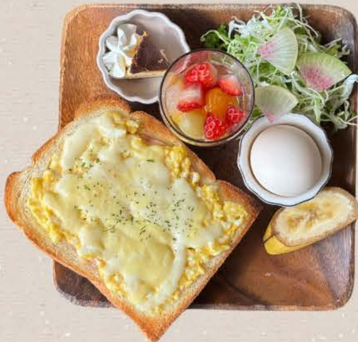
ハムエッグチーズトースト 800yen