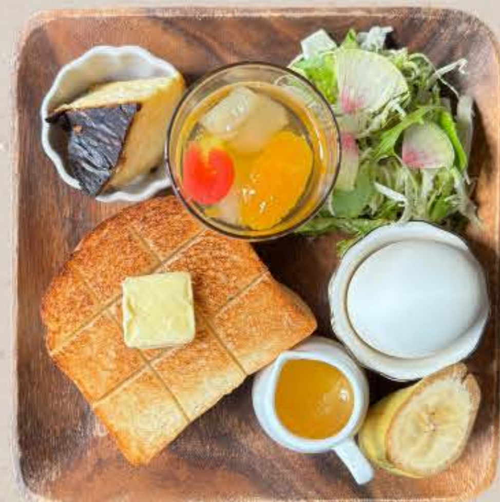
加西市産はちみつ×はりまる食パン ハニーバタートースト 800yen

当店大人気の「バスクチーズケーキ」 とフルーツポンチのミニデザート付き♪ ランチに大満足なプレートです。