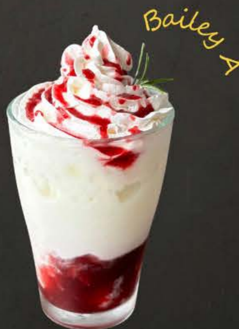
加西ベリーA ヨーグルトスムージー 750yen