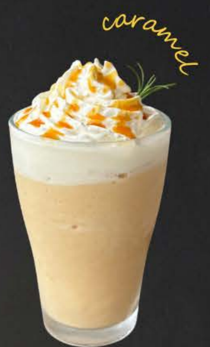
キャラメルフラッペ 700yen