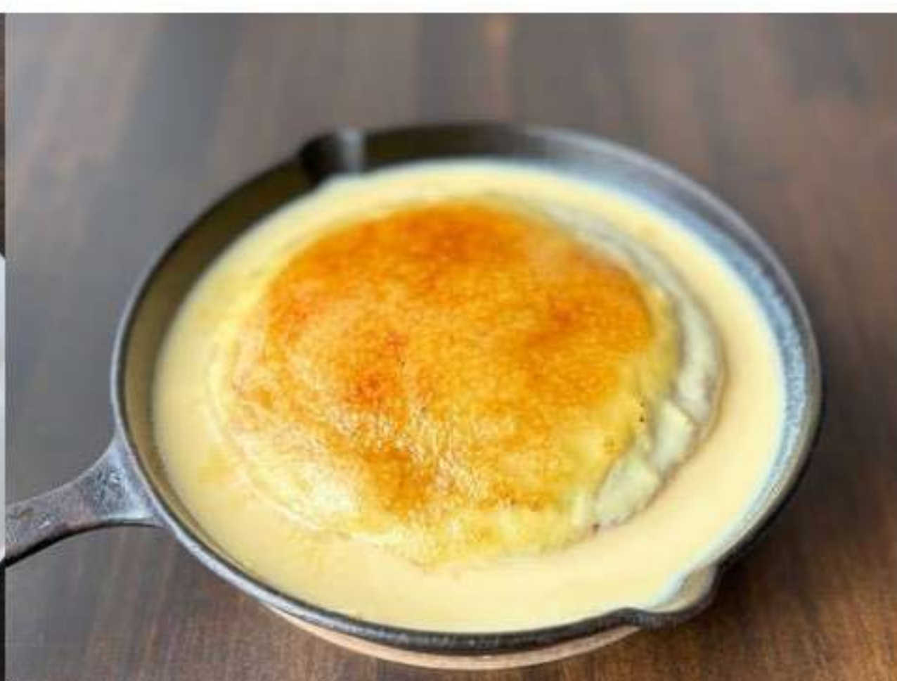
ブリュレパンケーキ 1,580yen