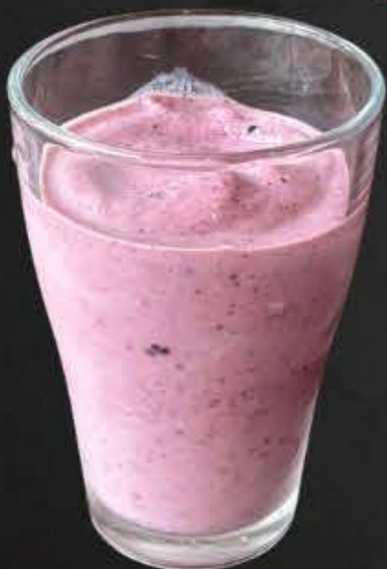
アサイースムージー 700yen