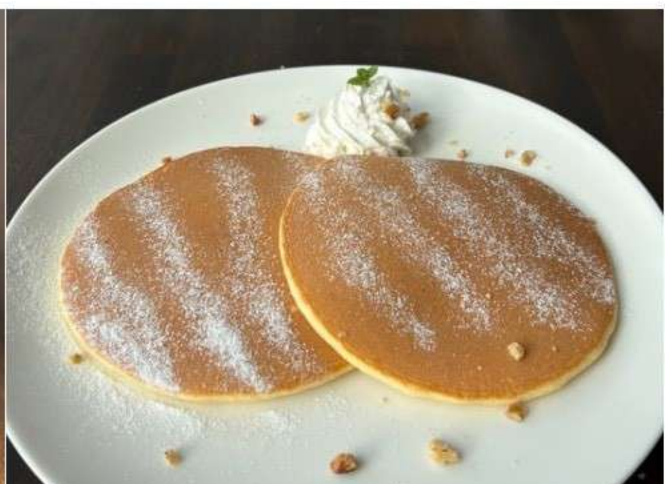
プレーンパンケーキ 800yen