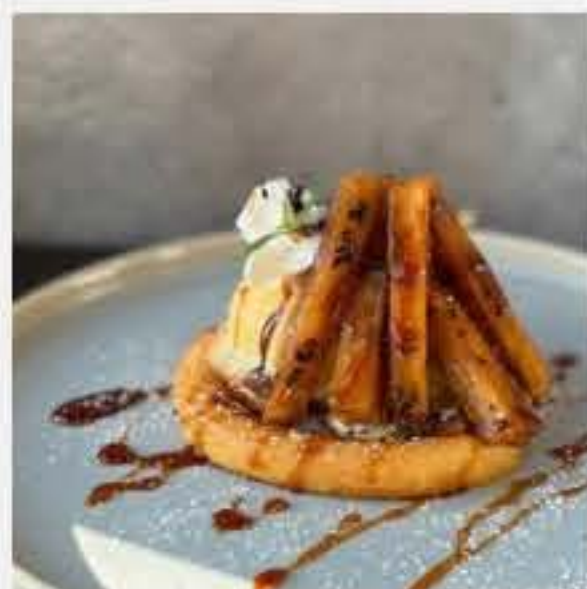
季節のフレンチトースト