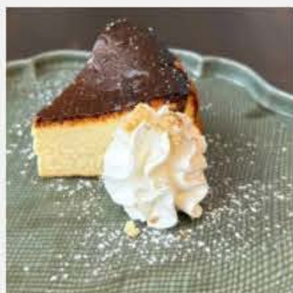
季節のバスクチーズケーキ