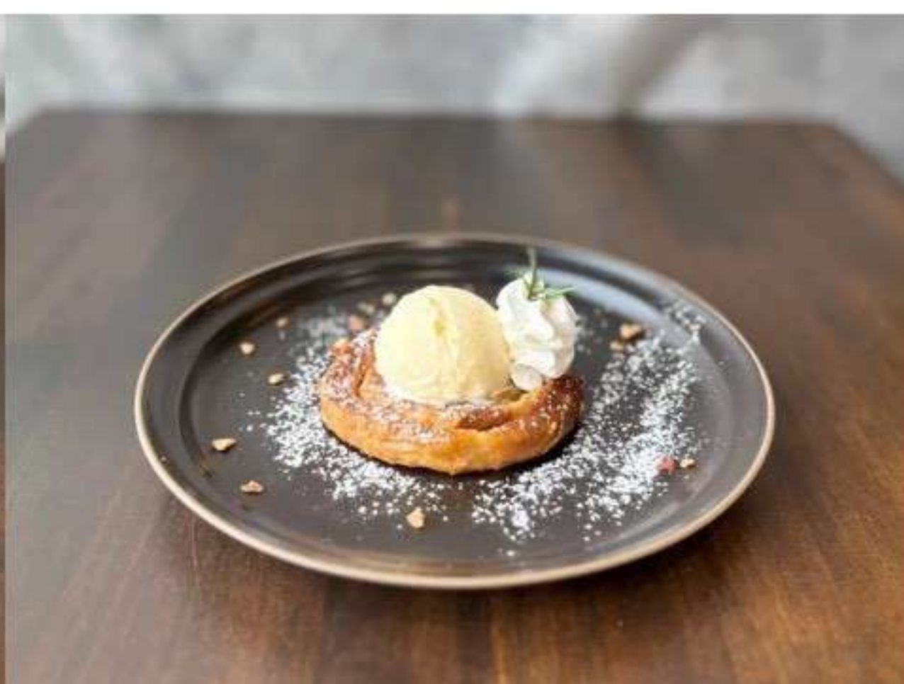
フレンチトースト 400yen